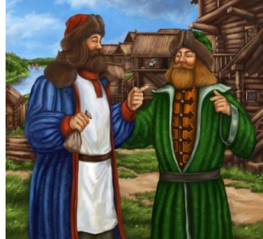
«Даю честное слово»