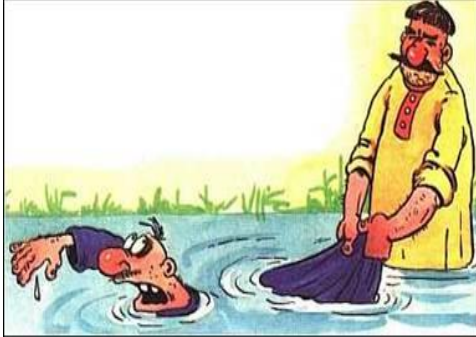
«Вывести на чистую воду»

Прочитай пословицы и иллюстрации к ним. Объясни, как ты понимаешь выражения под картинками? Выберите наиболее подходящий для себя вариант ответа.